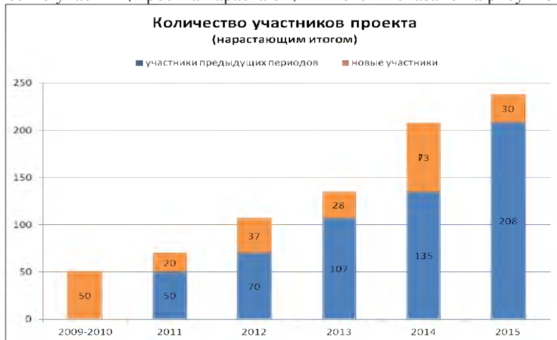
Рис. 3. Количество участниц проекта

Количество участниц проекта нарастающим итогом показано на рисунке 3.